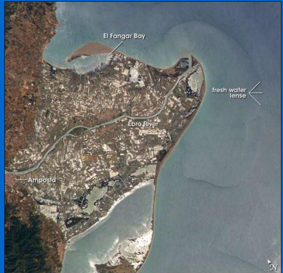
Formació del delta de l'Ebre