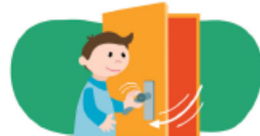
Obrir la porta.