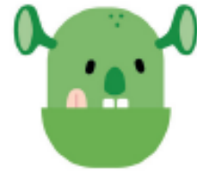
Un monstre pelat.