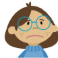
Una xiqueta trista.