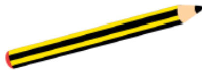
Un llapis llarg.

4 Completa amb paraules que signifiquen el contrari i dibuixa.